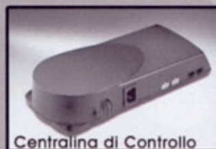
Centralina di Controllo

Installabile su tutti i modelli RIMOR (SuperBrig, Europeo e Saller) dotati di garage, QUICKLIFT vi permetterà di viaggiare in "Plein Air" con sorprendente versatilità.